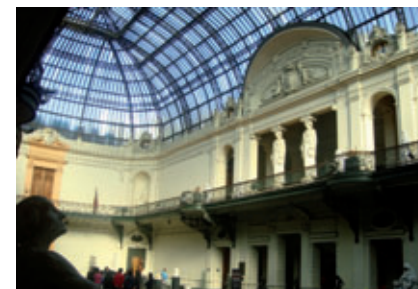
Museo Nacional de Bellas Artes Parque Forestal, s/n Santiago, Chile